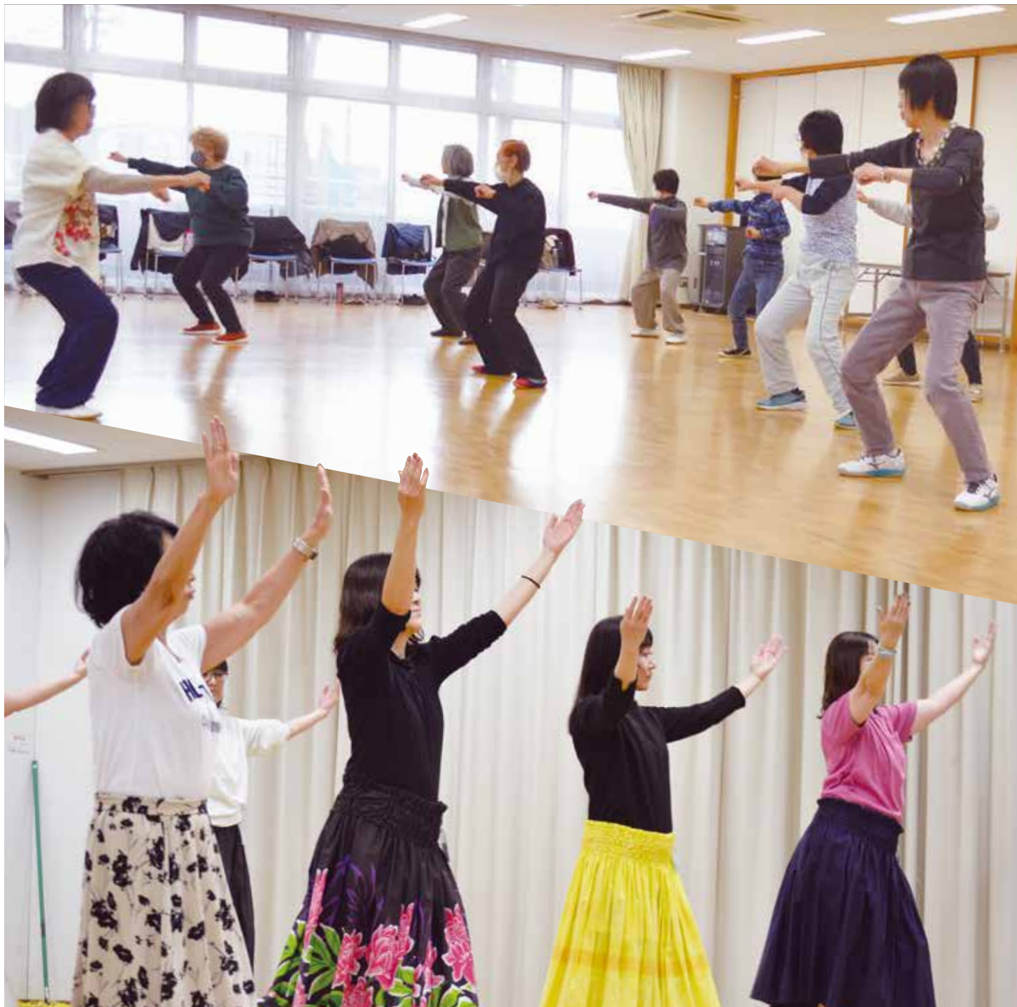
▲ 太極拳と、フラダンスの講座の様子