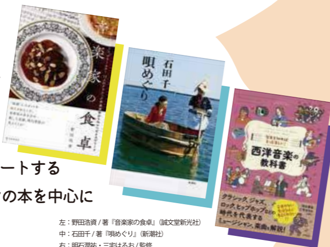
左: 野田浩貴/著『音楽家の食卓』(誠文堂新光社) 中: 石田千/著『唄めぐり』(新潮社) 右: 明石潤祐・三宅はるお/監修 『歴史を知ればもっと楽しい! 西洋音楽の教科書』(ナツメ社)

日常に“ちょい”っと読書を取り入れる「ちょい読み」 の展示をロビーで行っています。10月から新たにスタートする 「歌って楽しむ音楽の教科書」に合わせ、音楽がテーマの本を中心に 集めています♪ぜひお立ち寄りください。