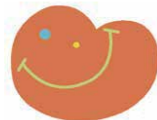
相模原キャラバン・メイト

平成27年の相模原市キャラバン・メイト連絡会発足時より、地域住民の方、商店、企業、学校など市内様々な場所で、認知症になっても安心してらせる相模原を目指し、認知症サポーター養成講座の講師として活動しています。