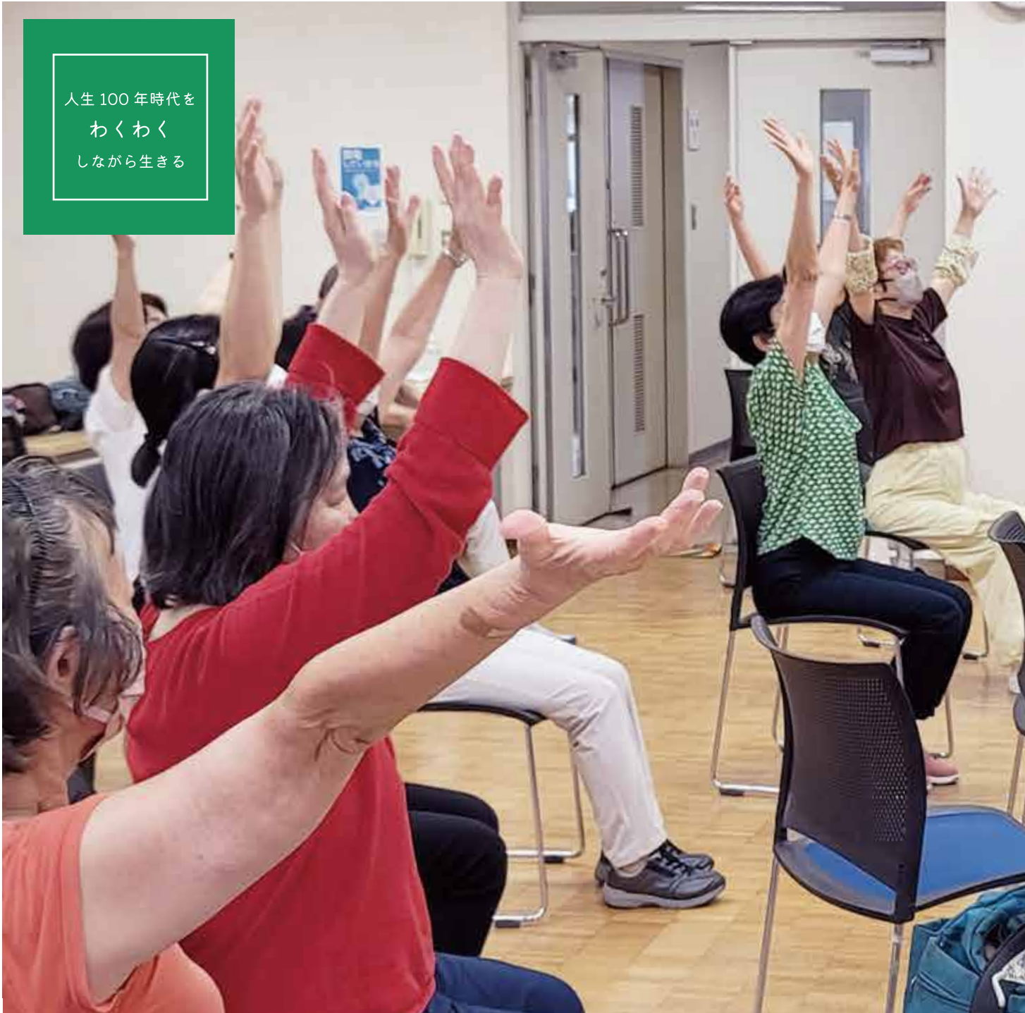
▲ふれあいサロン 脳トレ体操の開催の様子