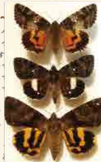
▲上からオニベニシタバ・コシロシタバ・キシタバ

現在でも、市内の「東林ふれあいの森」や「ともれびの森」で見ることができます。特にクスギの樹皮や樹液の周りに多く生息しています。5月下旬にはアサマキシタバ、6月上旬～フスキキシタバ、中旬～オニベニシタバ、7月～はコシロシタバ、キシタバ・マメキシタバが見られることでしょう。8月も見ることがありますが、早い時期の方が綺麗な個体をより多く見られます。