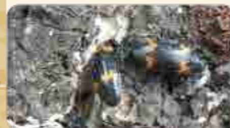
▲ キノコムシの仲間

倒木にはカミキリムシ類、ヒラタケなどのキノコにはキノコムシ類やゴミムシダマシの仲間を観察することができます。